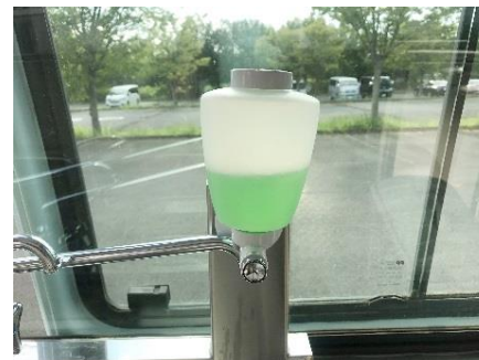
● 手洗い石鹸ホルダー