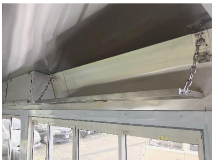
● 上部折りたたみ式収納棚