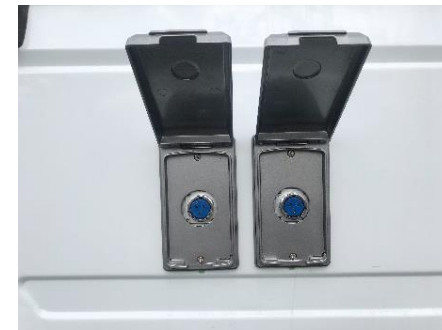
● 外部電源引き込み口 (100V 1500w) ● I H用電源引き込み口 (100V 1500w)