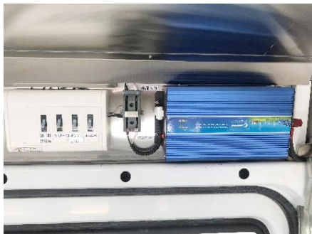
● 外部電気引込みブレーカー (30A) 車内コンセント