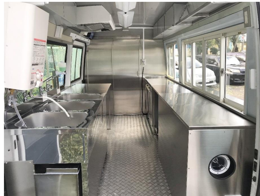
● 内装全体 (後方→前方)