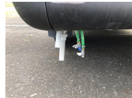
● 上水道直結口/排水口