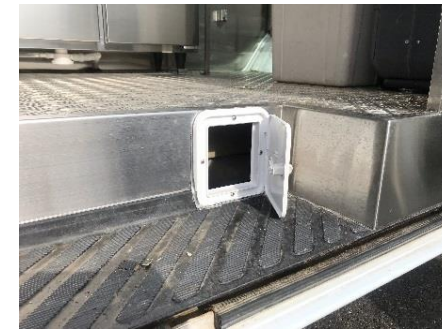
● ケーブル引き込み口