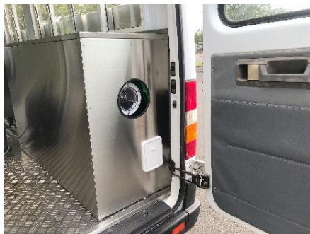
● 給水タンク (200ℓ)