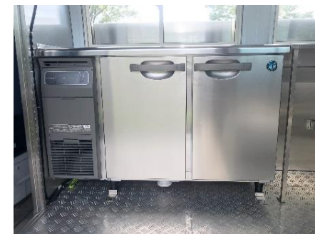
● 冷蔵コールドテーブル(165 L)