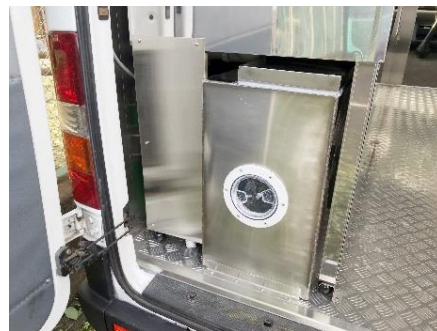
● 排水タンク (200ℓ)