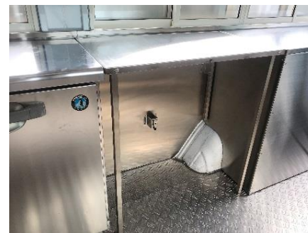
● 折りたたみ式作業台