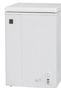
● 冷凍庫 ※オプションです