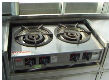
● ニロコンロ ※オプションです