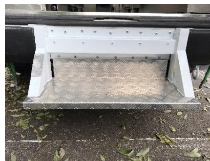
● 後部 ステップ