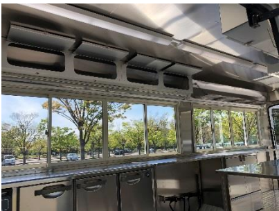
● 折りたたみ式収納棚&収納棚