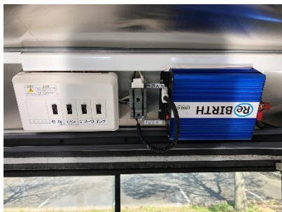
●外部電気引込みブレーカー (15A) 車内コンセント