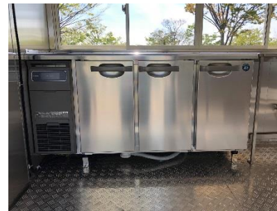
● 冷蔵コールドテーブル(225 L)