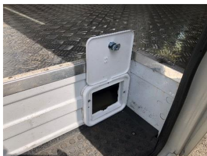
●ケーブル引き込み口