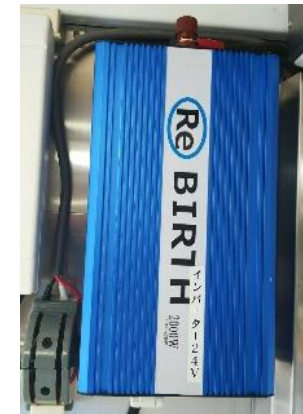
● インバーター(2.0kw) ※車両バッテリー使用