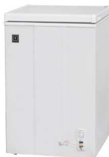
● 冷凍庫 ※オプションです