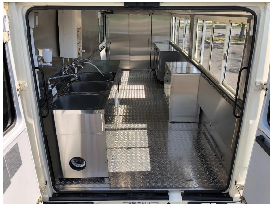
●内装全体 (後方→前方)