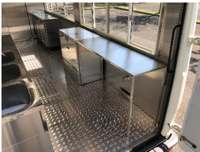
● 折りたたみ式作業台