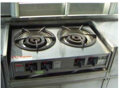
● ニロコンロ ※オプションです