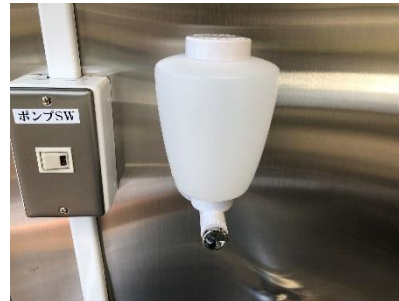
● 手洗い石鹸ホルダー