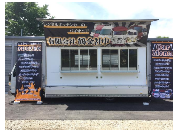
●ターポリン設置 イメージ