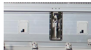
●ケーブル 引き込み口