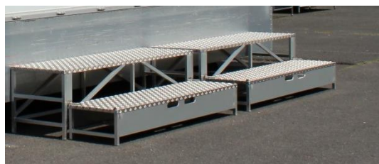
●販売面ステップ ® W1800×D940×H500 2台