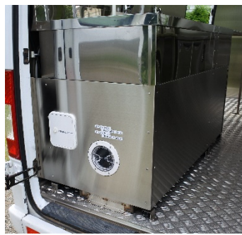
● 排水タンク (200ℓ)