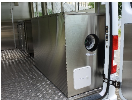
● 給水タンク (200ℓ)