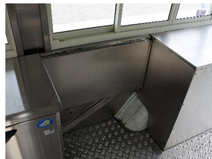
● 折りたたみ式作業台