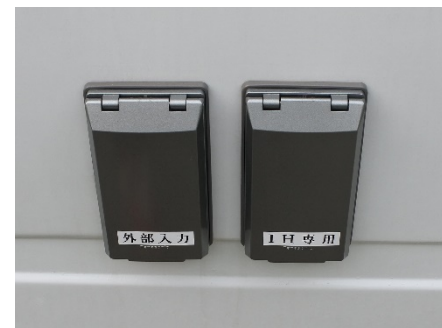
●外部電源引き込み口 (100V 1500w) ●IH用電源引き込み口 (100V 1500w)