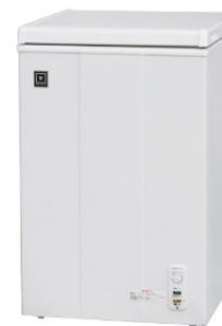
● 冷凍庫 ※オプションです