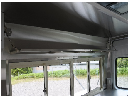
● 上部折りたたみ式収納棚