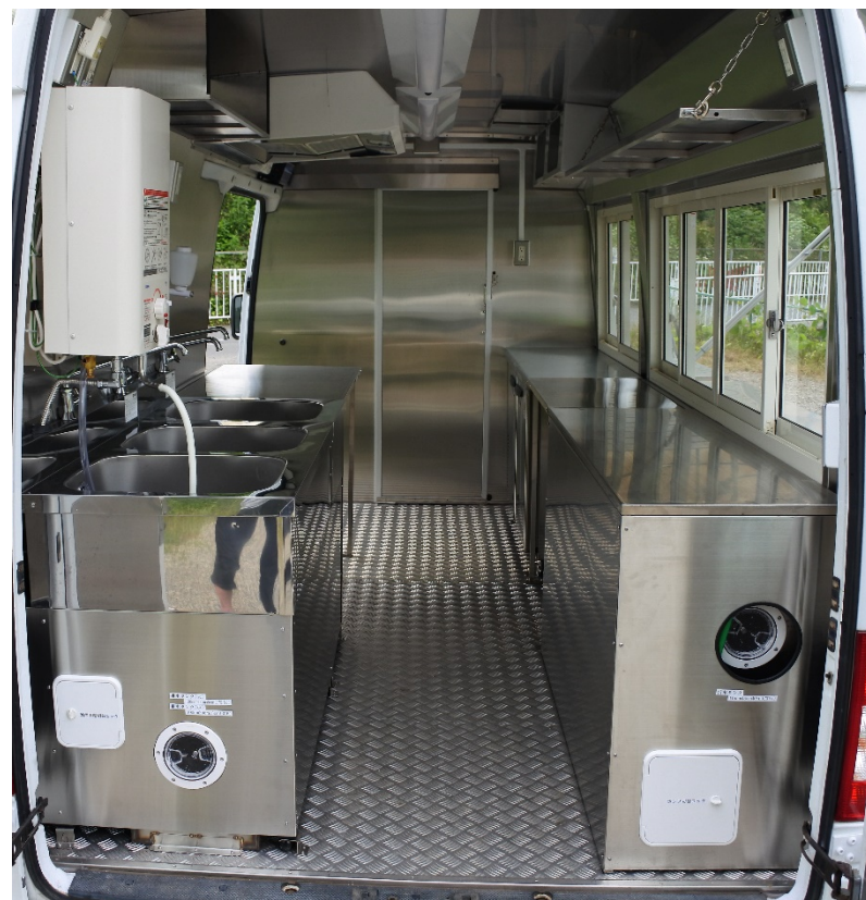
● 内装全体 (後方→前方)