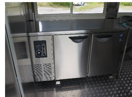
● 冷蔵コールドテーブル(174 L)