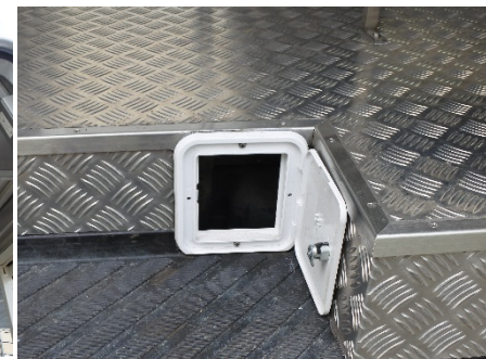
● ケーブル引き込み口