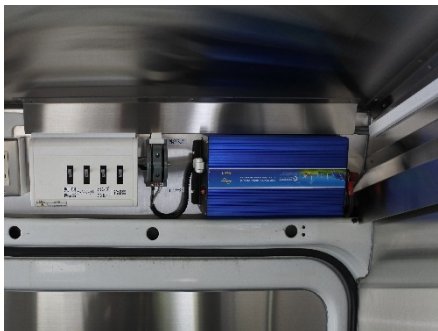
● 外部電気引込みブレーカー (30A) 車内コンセント