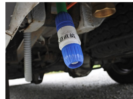
●上水道直結口/排水口