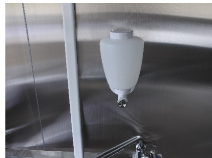
● 手洗い石鹸ホルダー